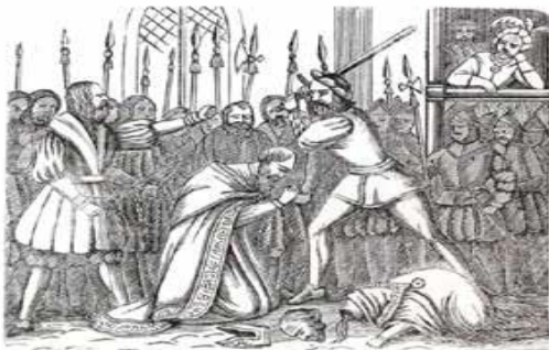
Den 6 November 1520.