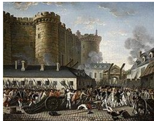
Stormningen av Bastiljen i Paris 1789

Just nu stiger spänningarna mellan demokratins anhängare och ett etablissemang som alltmer ogenerat inför globalismens totalitära system inom EU. Händelserna i Frankrike ställer utvecklingen på sin spets genom presidenten Macrons ingripande i syfte att genomdriva fundamentala lagändringar i strid mot den folkvalda majoriteten i landets parlament – Nationalförsamlingen.