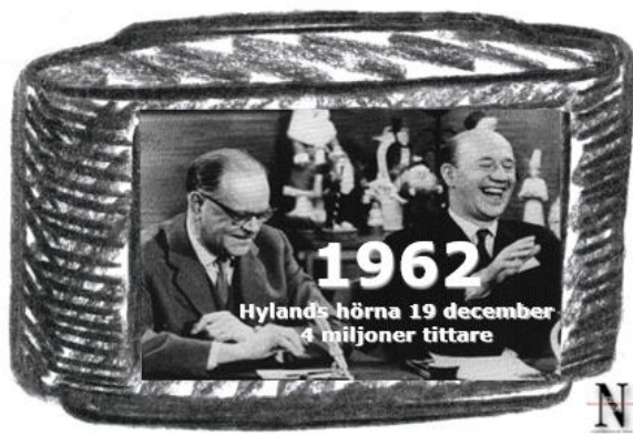
Tage Erlander och Lennart Hyland i Sveriges Television 1962