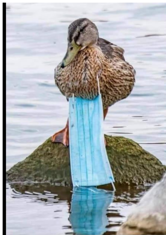
Coronan påverkar vår andlighet.