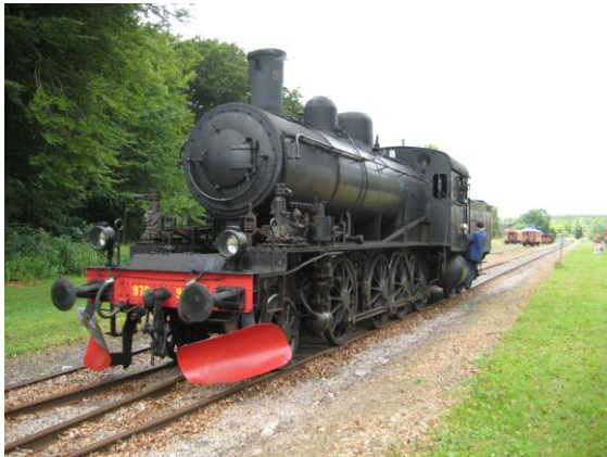
Svart ånglok på svart räls.

Hotet mot demokratin och den styrande maktelitens moraliska förfall påminner oss om författaren och nobelpristagaren Ernest Hemingway som alltid hade problem med sin ekonomi.