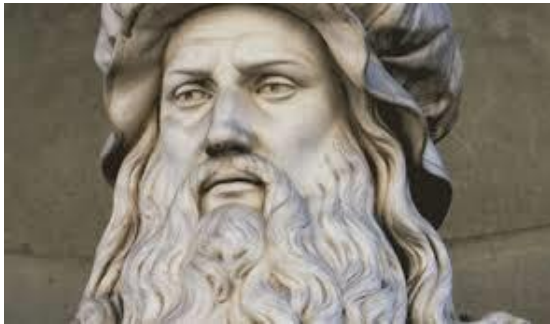
Leonardo da Vinci 1452-1519

Mänsklig utveckling drivs av vår perception. "All kunskap kommer från vad vi känner", skrev en gång renässans-människan Leonardo da Vinci .